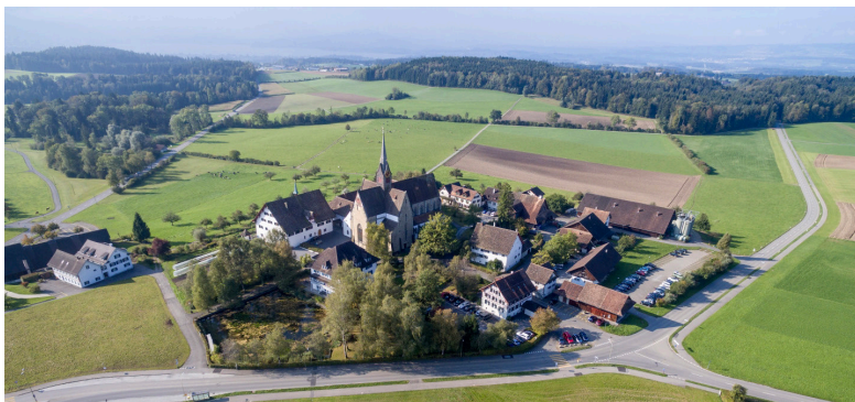
Luftaufnahme: Kloster Kappel a. Albis