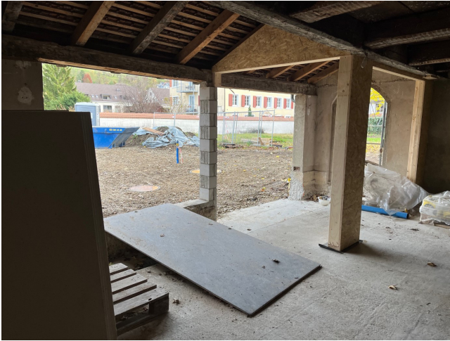
Eingangsbereich zum Foyer