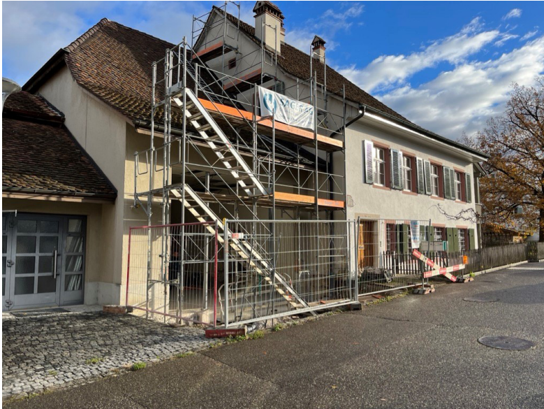
Blick von der Pfarrgasse

Die Arbeiten an der Gebäudehülle sind soweit fortgeschritten, dass nun die Westfassade des ehemaligen Wohnteils aufgefrischt werden kann. Bei dieser Gelegenheit wird auch der defekte Ziegelrechen erneuert.