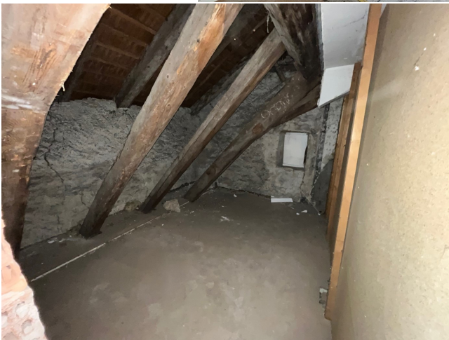
Durch Wanddurchbruch ein bis jetzt ungenutzter Hohlraum begehbar gemacht