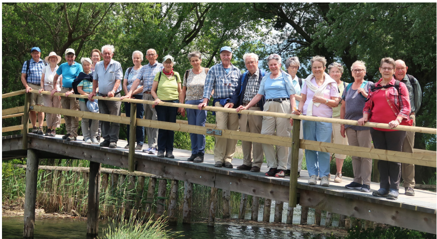
Wandergruppe Juni 2023 bei Flüelen UR