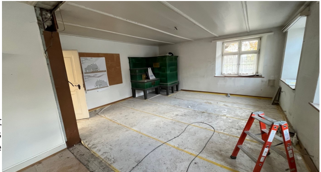
Vergößerter Raum mit Kachelofen im EG, vormals sogenannte Studierstube