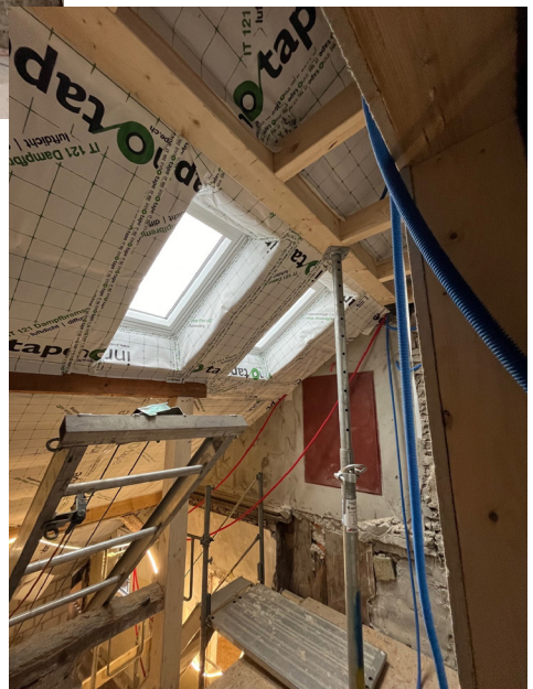
Ausbau ehemaliger Estrichräume mit neuen Dachfenstern