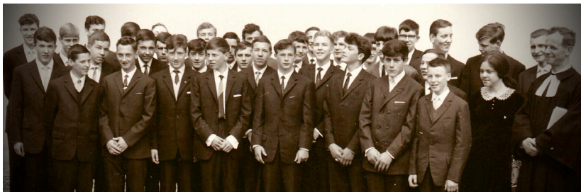
Konfirmation vor 58 Jahren: 1966